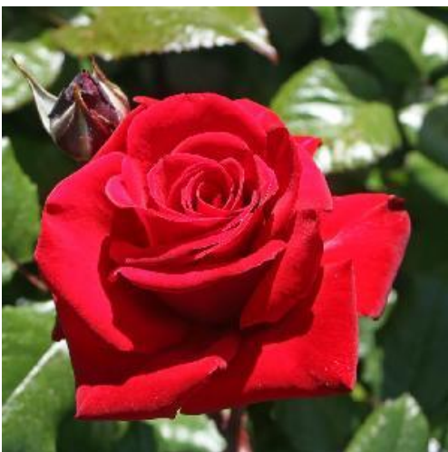
Joonis 2. Roos